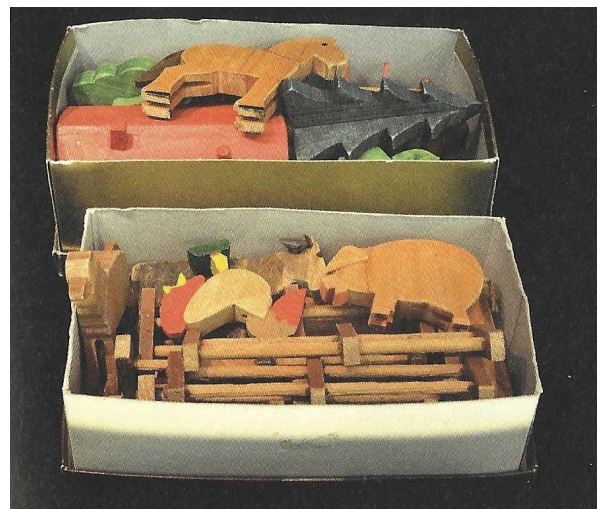
Bauernhof: Exponat 3.4.5.5